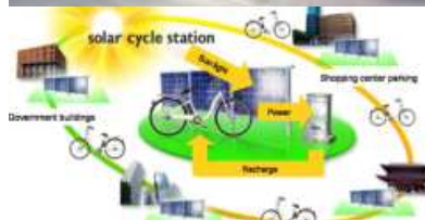
Parc à vélos à Shiga, Japon.

Kyocera Corporation a développé des stations de vélos électriquement assistés rechargés à l'électricité solaire. Ces stations sont également connectées au réseau conventionnel, à travers un onduleur DC/AC, qui garantit la stabilité du service en temps couvert ou pendant la nuit. De plus, les stations de charge sont équipées de sorties conventionnelles qui permettent de